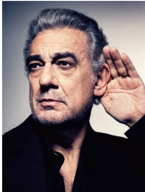
Plácido Domingo, Botschafter von Phonak.

Sonova steht für innovative Lösungen rund um das Thema Hören. Die finanzkräftige, global tätige Firmengruppe verfolgt eine Wachstumsstrategie und setzt auf Innovation, Kundennähe und pro-aktive Kostenkontrolle. Die Sonova Firmengruppe ist einer der drei grössten Anbieter von Hörsystemen weltweit, Marktführer in der drahtlosen Kommunikation für audiologische Anwendungen und Anbieter von professionellen Lösungen